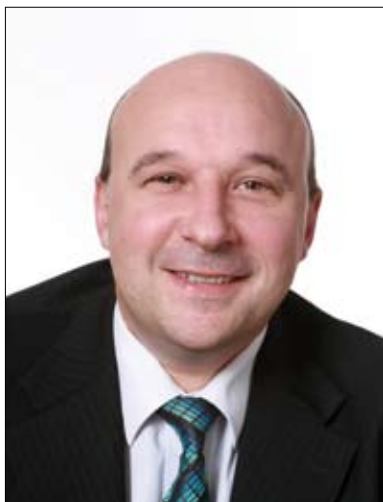
Gilles Etienne Cyrus Conseil